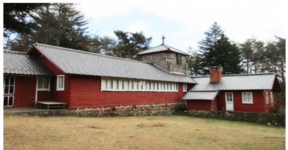
③清里聖アンデレ教会