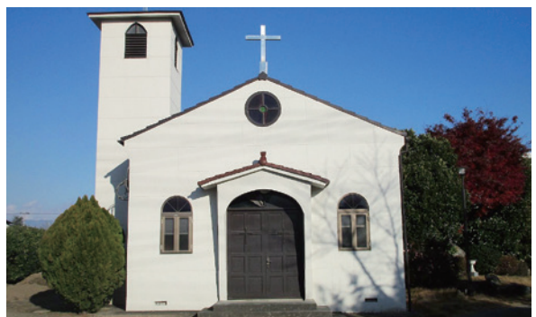
⑥カトリック山城教会