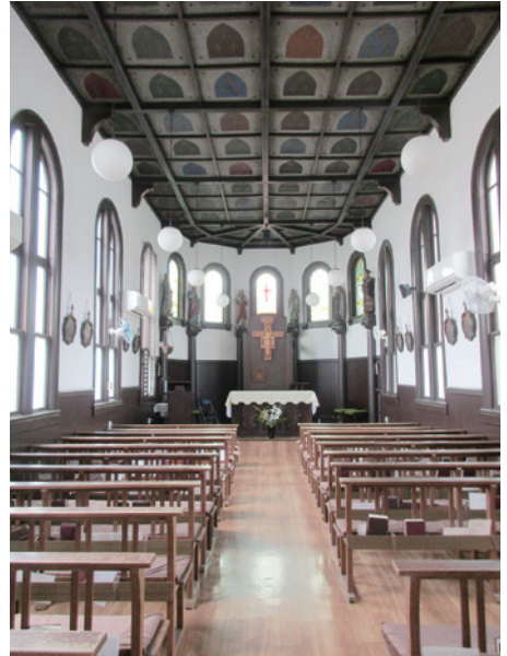
甲府カトリック教会聖堂内部

教会堂の隣の事務所にいた婦人に、訪問の趣旨を告げ見学させてもらう。外壁はモルタルの洗い出し仕上げで柱の位置にバツレスが付けられており、内部は単廊形式で北側に半円形の後陣(アプス)が配置されている。その部分に6人の聖人が祀られており、その中に袴姿の武士の像があった。肥前出身のトマス籠手田(こてだ)という方で、キリシタン弾圧で殉教した人物とのこと。6人の聖像は昭和3年に設置されたが、当時のフランス人神父の思い出があったと思われる。聖像の間にはステンドグラスが嵌められたアーチ窓がある。天井は格天井で柵目に文様が描かれてある。床は当初は畳敷きだったそうだ。率直な感想は「甲府にもまだこんな教会が残っていたのか。まさに知られざる文化財ではないか」という思いだった。