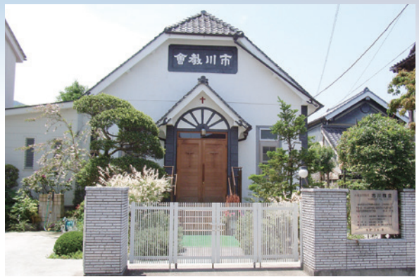
①日本基督教団市川教会