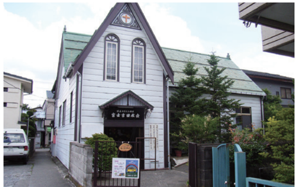
②日本基督教団富士吉田教会