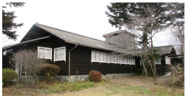
④日本聖公会長坂聖マリア教会