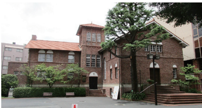
⑦日本基督教団早稲田教会