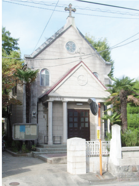
甲府カトリック教会聖堂

私がこの教会堂と出会ったのは2005年9月、知人からこの教会堂の取り壊しの話があるという情報を聞いたからだ。建築の専門外の知人は、『素人の自分が見ても取り壊すのは勿体無い建物だと思うのだが』と言って、一度見てもらえないかと言う。この教会堂は日本建築学会編纂の「日本近代建築総覧」にも掲載がなく、私もその存在を知らなかったので早速訪ねてみた。