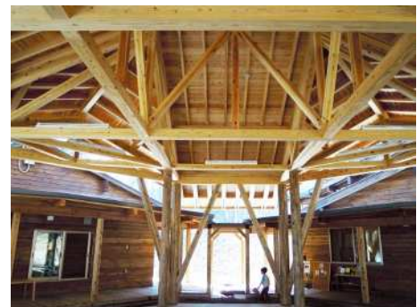
建物中央の大広場

柱材、梁材、床材、外壁材に、敷地の伐採 材をはじめとした地元の木材を用いて、無垢 材の良さを活かしている。